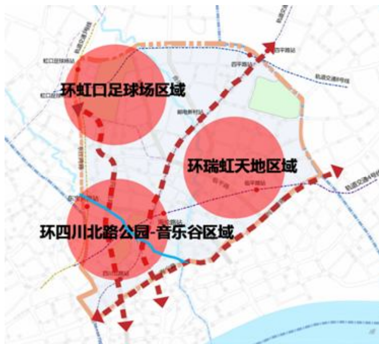
图 1：中部地区“一带三轴三环”布局示意图