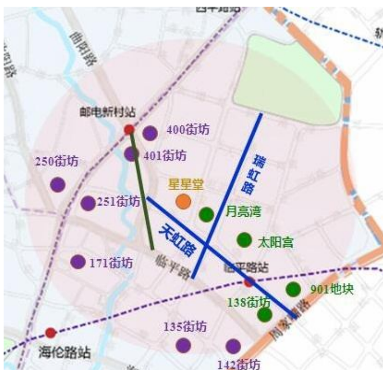
图 4：环瑞虹天地区域项目建设分布图

三是推进区域内部分市政道路建设项目。改善新建路隧道出口周边交通环境、完成海伦路、海拉尔路拓宽。推进曲阳路辟通启动，推进海伦西路、安丘路辟通的前期研究。结合瑞虹天地项目建设，辟通拓宽天虹路、虹关路、天镇路，完善瑞虹新城地区的道路体系，进一步提升道路景观效果。