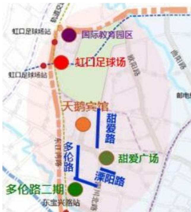
图 2： 环虹口足球场区域项目建设分布图

四是以配套资源整合和环境整治为抓手，促进有效资源集聚。推动以中部地区旅游景区服务能级提升，突出文化节庆和品牌活动的组织协调，加强智慧旅游基础设施建设。进一步鼓励博物馆、艺术馆、展览馆和各类文化休闲场馆集聚，完善周边商业配套。推动天鹅宾馆等老旧宾馆加快改造提升，引进专业酒店管理集团。进一步整合设计旅游观光线路，进一步优化交通线路，推进停车设施共享开放，长效整治周边道路环境，形成幽静雅致的氛围，彰显海派文化。